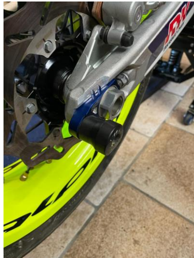
Schleifer an Hinterachse