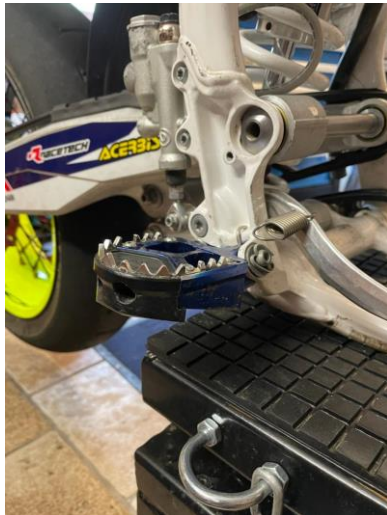
Schleifer an Fußraste